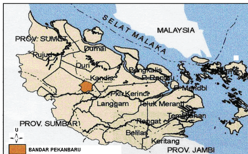
RAJAH 1. Kawasan kajian

Telah berlaku perubahan guna tanah cukup bererti iaitu perkebunan, daripada 59.38% pada tahun 1992 menjadi 49.26% pada 2004, dan hutan daripada 13.84% pada tahun 1992 menjadi 13.06% pada tahun 2004 (Jadual 1). Daripada aspek ruang, telah berlaku penurunan